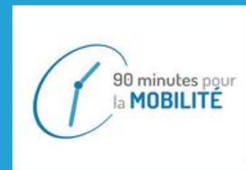
Séminaires « 90 Minutes pour la Mobilité »