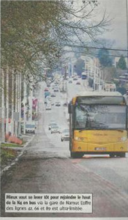
Mieux vaut se lever tôt pour rejoindre le haut de la N4 on bus via la gare de Namur l'offre des lignes 42, 66 et 89 est ultra-limée.

un autre problème : la sécurité. « Les employés pourraient monter à pied, depuis le feu situé 600 mètres plus bas. Mais marcher là, c'est très dangereux. On ne peut pas le con- seiller à nos clients et nos collabora- teurs. » « Mais pour des alternatives de mobilité douce. « Certains viennent à vélo, ou aiment le faire. Je suis prêt à mettre des vélos électriques à disposition. Mais pour cela, il faud- rait une bande pour les protéger. » Il confie : « Un de nos employés s'est déjà fait renverser, avec une incapacité à vie. » Pour Jean-Benoît Boulengé, il se- rait intéressant de relancer un dé- bat. « Il faudrait rassembler autour de la table les entreprises du Grepan (lire par ailleurs), le TEC, le SPW mobilité, la Ville et les riverains. Actuel- lement, tout le monde fait un peu avec les moyens du bord, sans réfléchir. » L'UCM organise chaque année une étude de mobilité. Les em- ployés seraient-ils prêts à changer leurs habitudes ? Emprunterai- ent-ils ces bus ? « C'est une bonne question. C'est une enquête que nous devons mener en interne. Il est clair que les transports en commun en général ne rentrent pas dans les moyens. Mais s'il n'y en a pas, ça ne peut pas s'améliorer. » Il termine : « Je suis conscient qu'il faut trouver un équilibre, qu'il y a aussi une question de rentabilité pour le TEC. Le pro- blème n'est pas facile. »