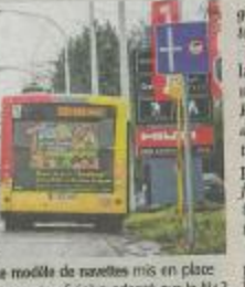
Le modèle de navettes mis en place au zoning Créalys adapté sur la N4 ?

« En 2006, une série d'entre- prises du zoning Créalys (Les Lunes, Gembloux) ont uni leurs forces pour créer un club. Objectif de l'IASBL Idéalys : pro- poser des navettes de bus, au dé- part de la gare de Namur vers leur parc d'activités. » Le club rassemble la plupart des sociétés du zoning, mais aussi le BEP. « Sur Créalys, il y avait une ligne qui desservait l'At- trium du parc. Mais le TEC a décidé de la supprimer car elle était peu utilisée », explique Stéphanie Bonmarriage, coordinatrice du volet implantation d'entre- prises pour le BEP.