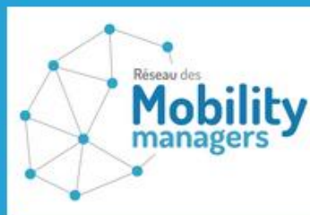
Réseau des Mobility Managers