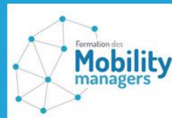
Formation des Mobility Managers