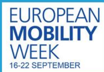
Semaine de la Mobilité