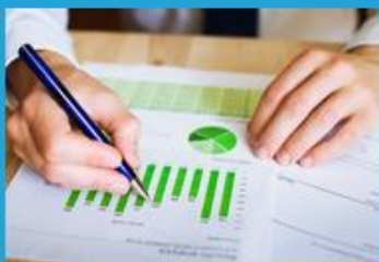
Bilan Mobilité de votre entreprise