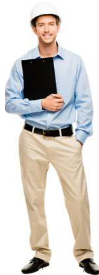
Ingénieur/ Chef de projet