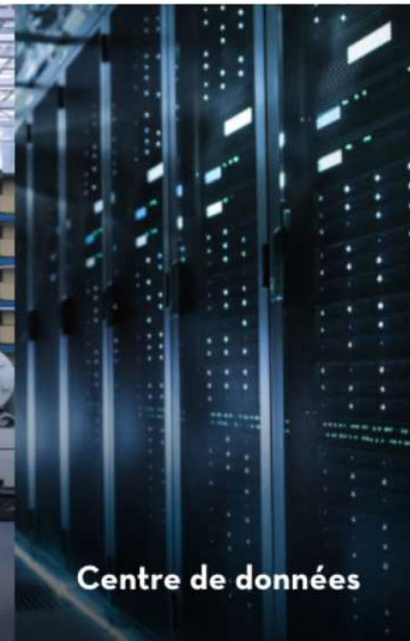
Centre de données

Mobilité – Energie – Logistique – Culture – Industrie – Commerces – Services