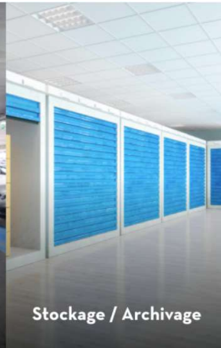
Stockage / Archivage